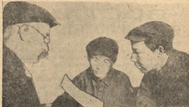
Литейщики за обсуждением постановлений правительства.