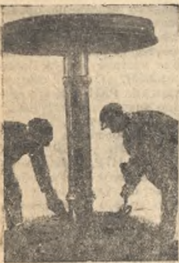
За посадкой бандожей.